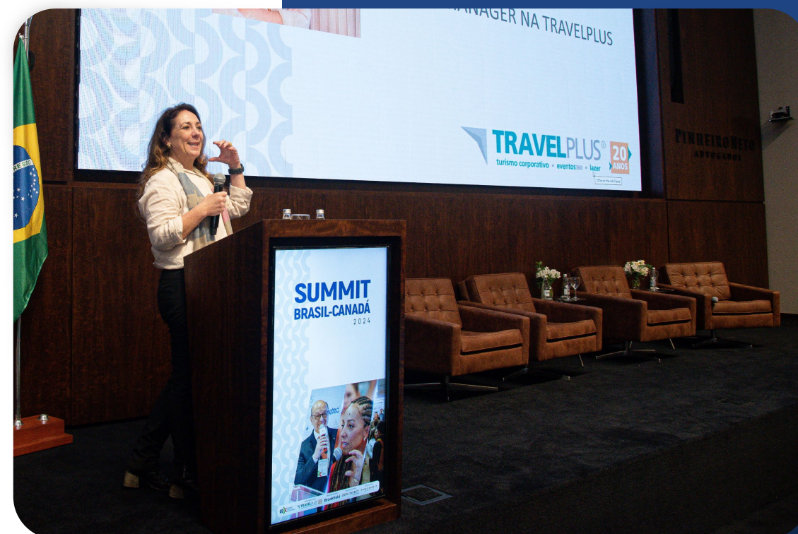
Foto da empresa associada TRAVELPLUS , com Cota Prata ela teve um painel exclusivo dentro do Summit Brasil-Canadá 2024.